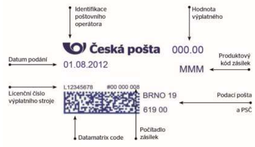
Obr. 2: Rozmístění informací na digitálním otisku

2D - datamatrix code obsahuje řetězec zakódovaných informací sloužící pro kontrolu a autenticitu informací o zásilce.